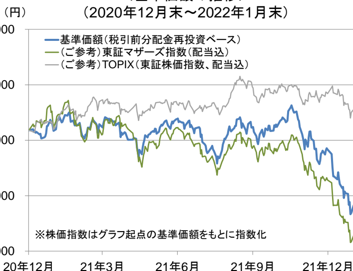
＜2022年1月末時点の騰落率＞